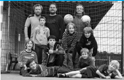
Wer ist der Stärkste?