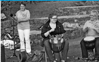
Im Rhythmus der Burg