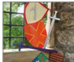
Schild & Schwert

Welches Kinderherz schlägt nicht höher bei der Vorstellung, auf einer Burg zu übernachten? Es stehen dafür 45 geräumige Zimmer, zum Teil als Appartements mit bis zu 111 Übernachtungsmöglichkeiten, zur Verfügung, die alle mit Dusche und WC ausgestattet sind. Fünf Zimmer sind behindertenfreundlich eingerichtet. Als Gemeinschaftsräume können der Burgsaal, die Burgwohnstube oder zwei klassische Seminarräume genutzt werden. Weiterhin gibt es einen Kreativ- sowie Meditationsraum. Für die Kleinsten lohnt sich ein Abstecher auf die Miniaturburg in der hauseigenen Krabbelstube.