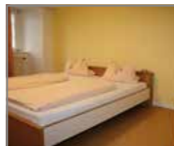
Blick in ein Zimmer

Unsere Küche empfängt Sie zu den Mahlzeiten im „Alten“ und „Neuen Speisesaal“ mit herrlichem Ausblick. Zu den Essenszeiten bieten wir täglich frisch zubereitete, leckere Speisen. Unsere Buffets sind abwechslungsreich und kindgerecht.