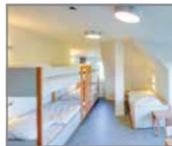
Blick in ein Mehrbettzimmer

Zu den Mahlzeiten empfängt Sie unsere Küche im Speiseraum des Hauses. Das abwechslungsreiche Menü bietet Ihnen eine gesunde und ausgewogene Ernährung. Das reichhaltige Buffet hält kalte und warme Speisen bereit. Alle unsere Gerichte werden täglich frisch zubereitet.