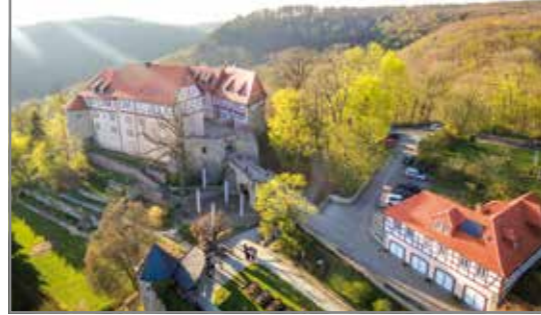
Zu Gast auf Burg Bodenstein