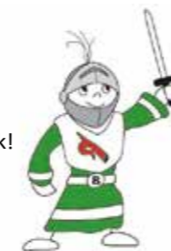
„Ritter Bartholdy“ Maskottchen