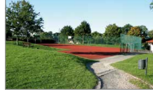
Familienspielplatz „Am Bornberg“