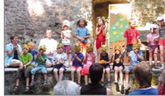
Kleine Leute machen großes Theater