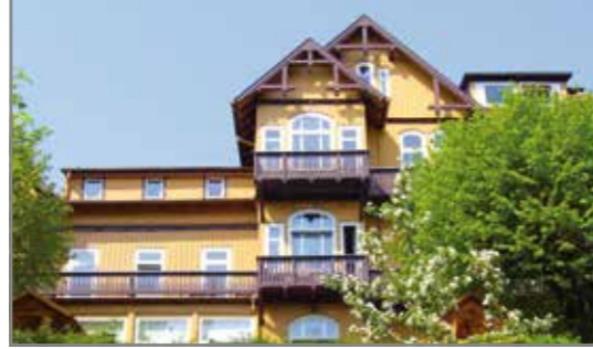
Zu Gast in der Jugendbildungsstätte Junker Jörg